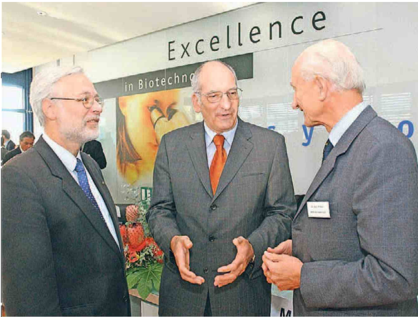
Der damalige Bundesrat Pascal Couchepin weihet den Bio-Technopark Schlieren im Jahr 2002 ein. Seltsam, aber wahr. Die offizielle Gründung erfolgte dann erst 2003.

Die Fotos auf dieser Seite zeigen Stationen der 10-jährigen Geschichte des Bio-Technoparks auf.