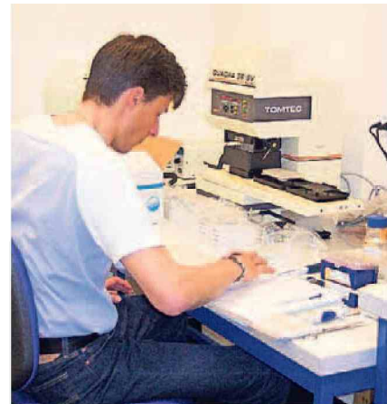
ESBATEch-Mitarbeiter 2004 im Labor. Heute ist die Firma Teil der Novartis-Familie. JK