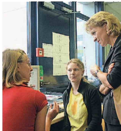
Die damalige Regierungsrätin Rita Fuhrer unterhält sich 2004 mit Prionics-Mitarbeiterinnen.