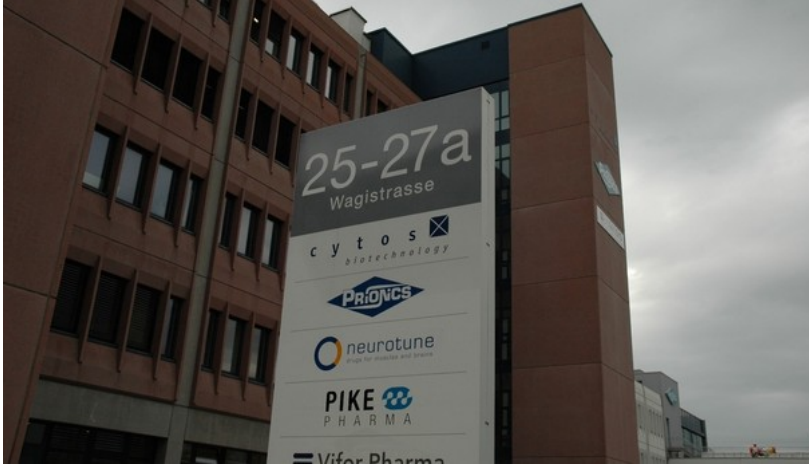
Eine Berner Firma wird ihren Firmensitz in den Bio-Technopark verlegen. (Symbolbild)

Die Berner Biotech-Firma Kenta verlegt ihren Firmensitz nach Schlieren in den Bio-Technopark. Der neue Standort sei die bestmögliche Lage für ein junges und innovatives Biotechunternehmen in der Schweiz, teilte Kenta am Donnerstag mit.